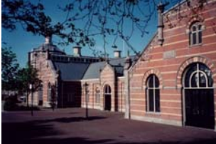
Pompgebouw de Esch

Een greep uit de locatie mogelijkheden in Rotterdam en omgeving: